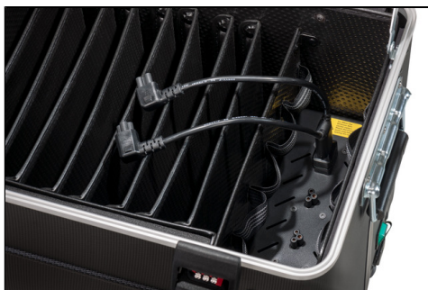
- Staufach für Netzteil